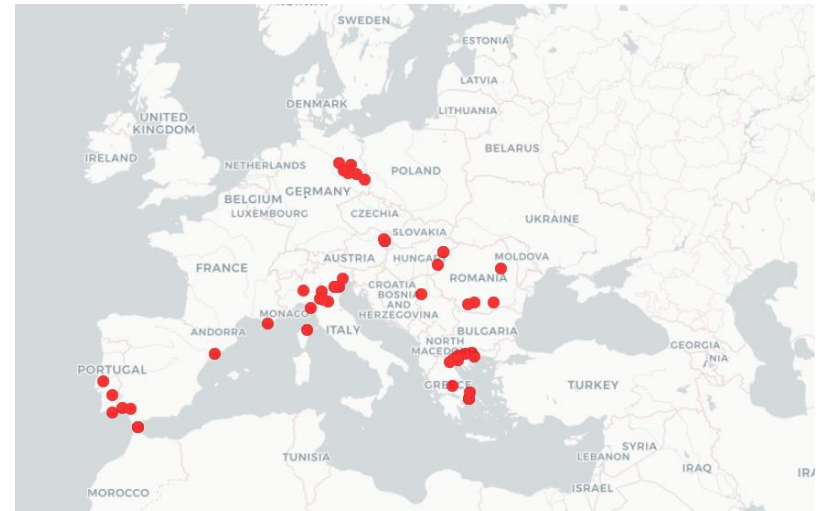
Figura 1. Distribuzione geografica dei casi (probabili e confermati) di West Nile Disease in Europa e nel bacino del Mediterraneo